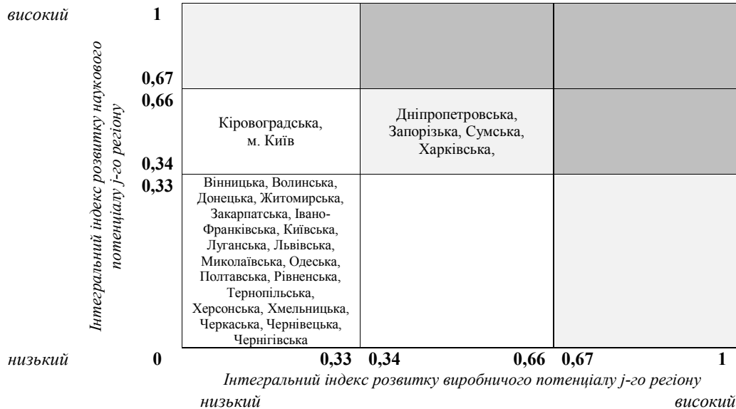
Рис. 4. Матриця сегментації регіонів України за рівнем інноваційного розвитку у 2015 році

Примітка: складено авторами на основі даних табл. 7.