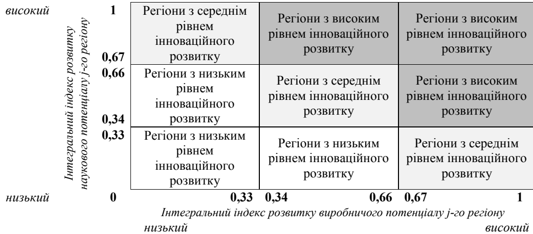
Рис. 2. Матриця сегментації регіонів за рівнем інноваційного розвитку